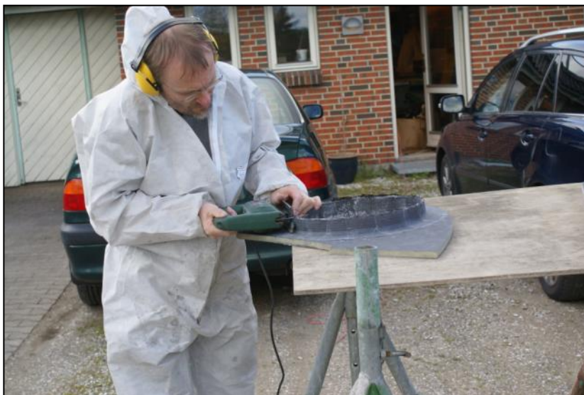
Kanter på skodder skæres til

Vi forsøgte på mange måder, og til sidst varmede vi stålrøret op med en varmepistol, og da det var godt varmt, kunne vi trække glasfiberrøret af uden større anstrengelser.