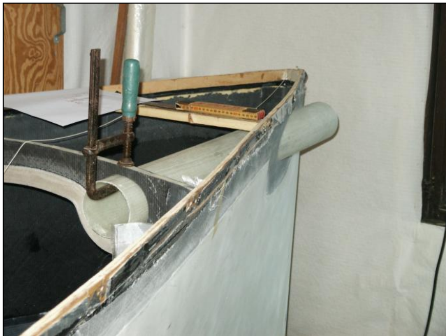
Røret til bogsprydet sættes i båden