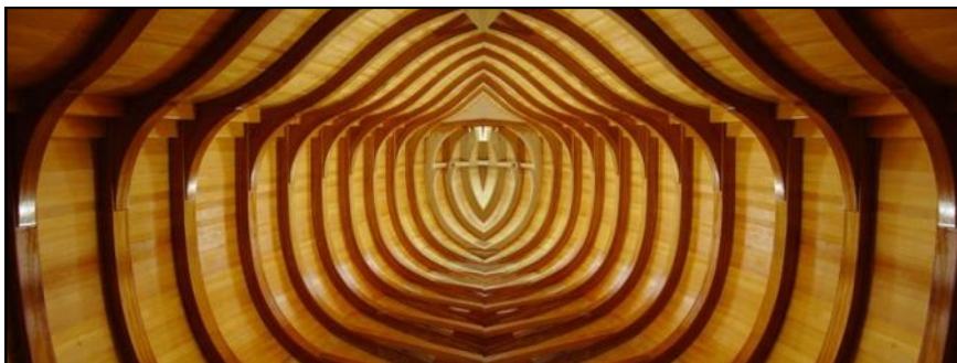
Det indre af skroget før aptering

Man kan læse mere om båden på : www.langskip.com .