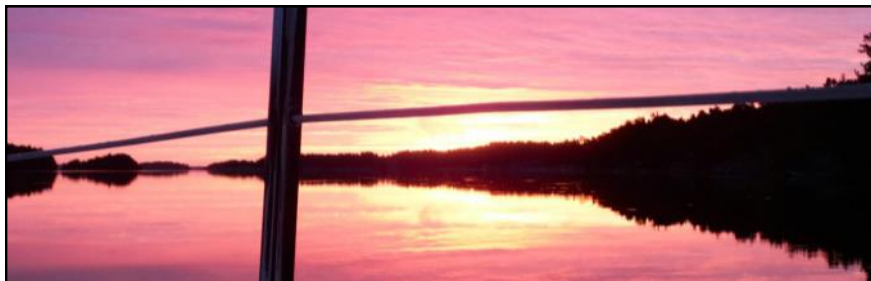
Solnedgang i Norrviken Uvön

Aalborg • Aarhus • Frederikshavn Hjørring • Randers • Padborg • København