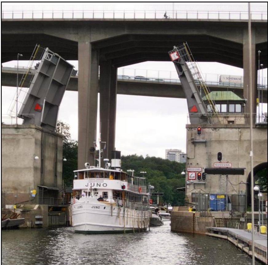
Entre til Mälaren gennem Hammerby Slusen, Stockholm

Fra Stockholms skærgård gik vi mod syd til Mem for at påbegynde turen fra kyst til kyst gennem Gøtakanalen, hvor beretningen fortsætter i næste blad.